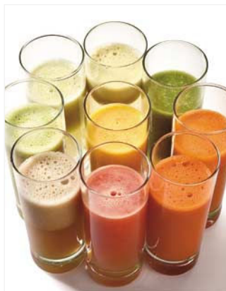
Repare você mesma o seu suco

Depois da dieta, seu organismo estará equilibrado, o que possibilitará uma queima eficiente de gordura. Mas não adianta se encher de besteiras no dia seguinte! Mesmo porque, em apenas