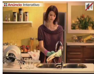
publicidade | anuncie